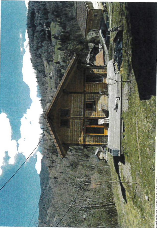
Insertion depuis l'arrière du chalet. Existant

Envoyé en préfecture le 20/06/2023 Reçu en préfecture le 20/06/2023 Publié le 20/06/23 ID : 074-217400795-20230615-2023_032_DE.DE