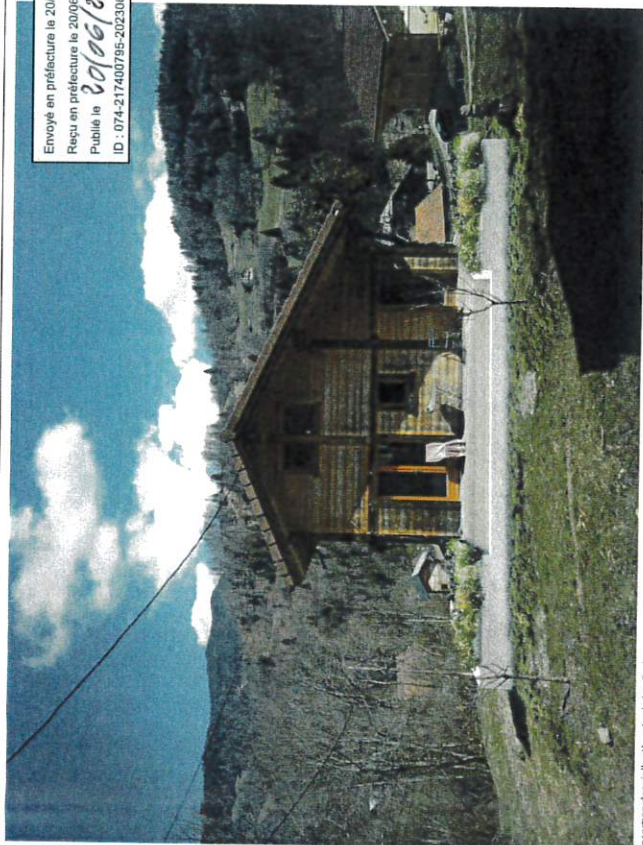
Insertion depuis l'arrière du chalet. Projet