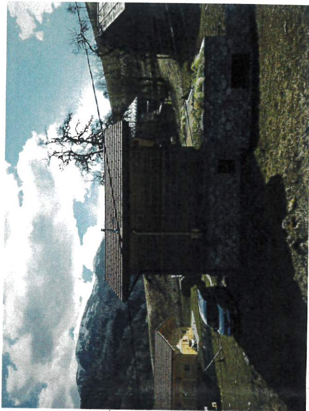
Insertion depuis le côté du chalet. Projet